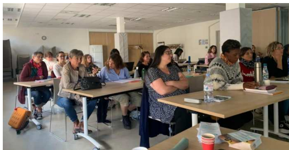
Île de France